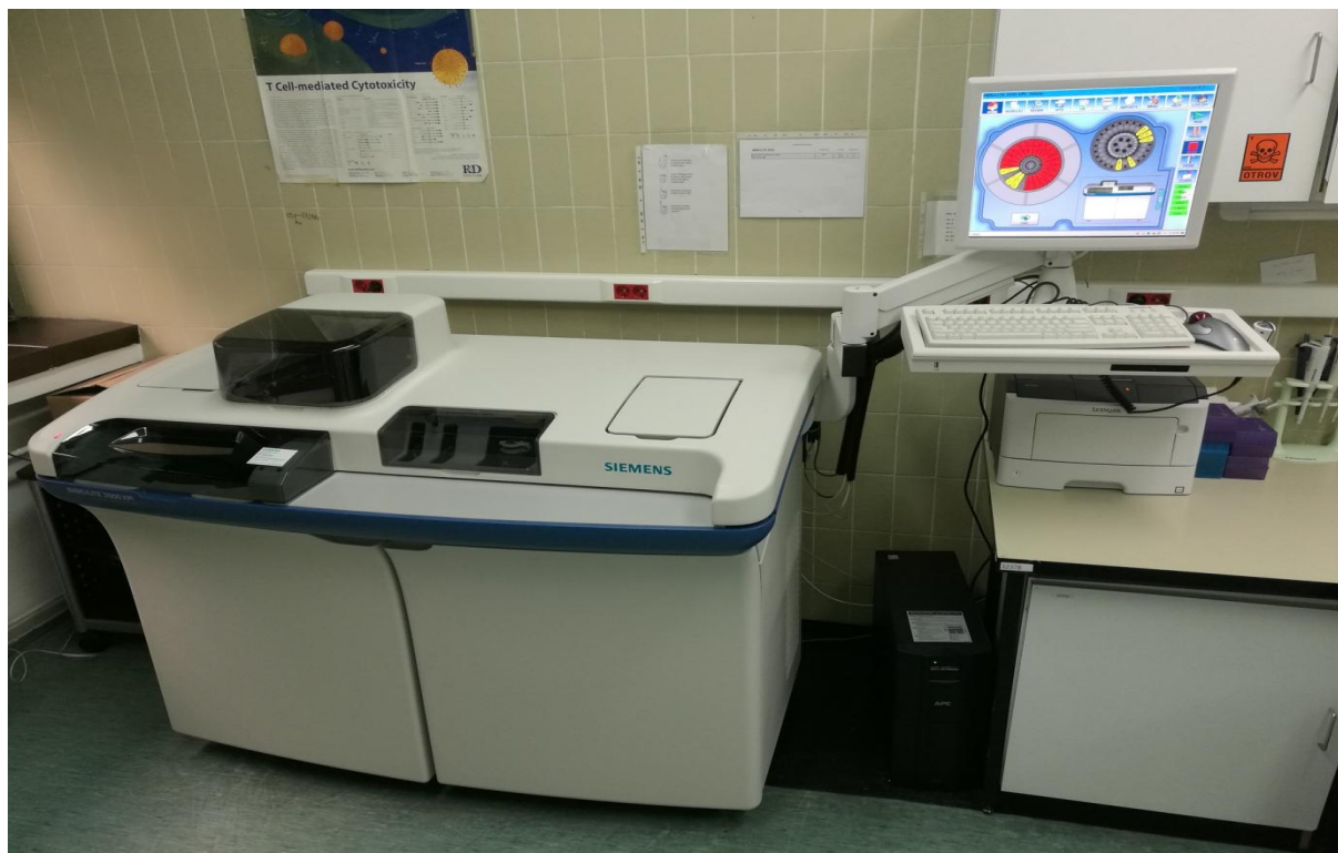
Slika 1. Immulite 2000 imunokemijski analizator (Siemens), KBC Osijek