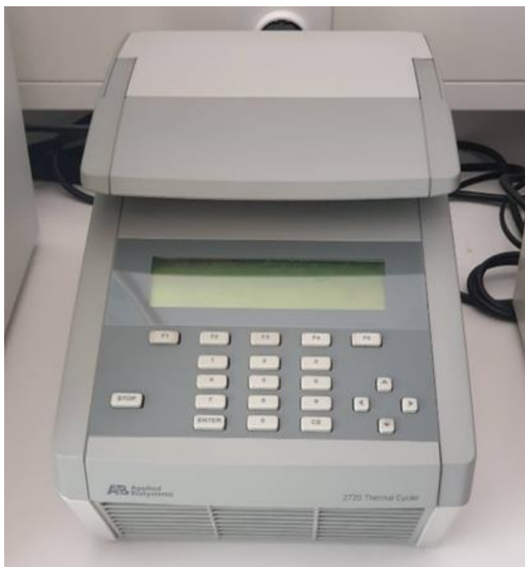
Slika 3. Uređaj za PCR 2720 Thermal Cycler, Applied Biosystems korišten u istraživanju (fotografija snimljena u Laboratoriju za medicinsku genetiku Medicinskog fakulteta u Osijeku, kolovoz 2019.)