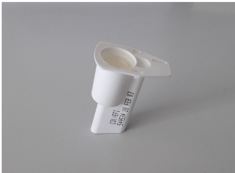
Slika 2. Testna kazeta Col/Epi.

Formiranje tromba u PFA sustavu je pod utjecajem sniženog broja trombocita, njihove smanjene aktivnosti, snižene razine vWF u plazmi ili smanjenog hematokrita (11).