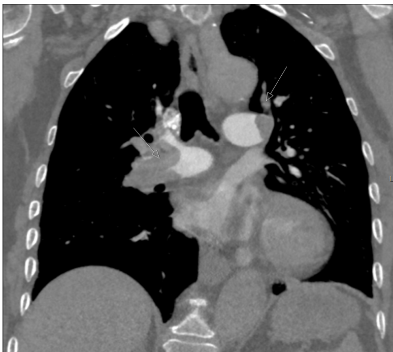
Slika 1. Koronarna rekonstrukcija CT angiografije plućnih arterija s prikazom trombotskog sadržaja obostrano unutar glavnih plućnih arterija i segmentalnih ogranaka-označeno strelicama (fotografirao autor rada)