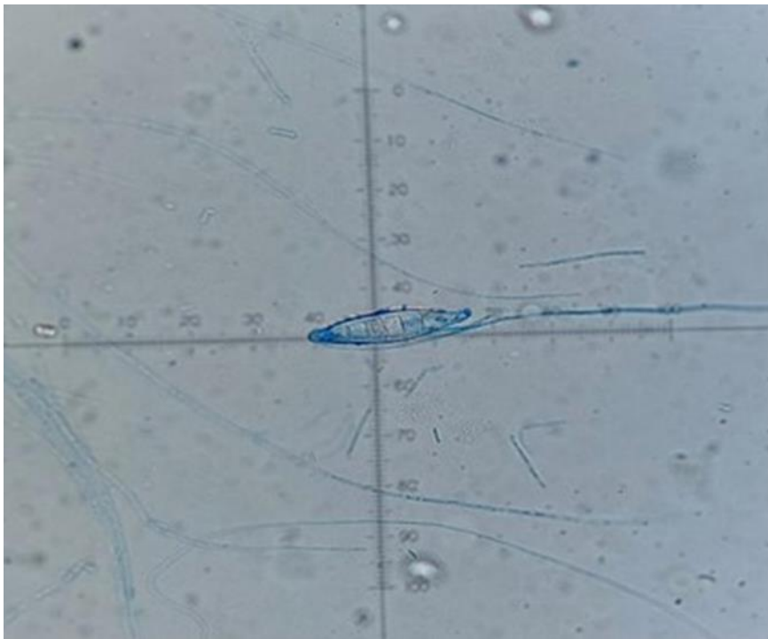
Slika 7. Izgled makrokonidija, bojano laktofenolom