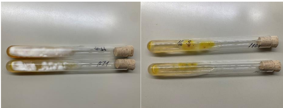
Slika 2. i 3. Kolonije M.canis , Sabouraud agar

M.canis spada u brzorastuće dermatofite pa se često porast vidi nakon 5 - 7 dana. Porasle kolonije imaju bjelkastu, pahuljastu površinu, s radijalnim brazdama i žutim pigmentom na periferiji, reverzna strana kolonija je tamno žute boje koja starenjem postaje smečkasta. Na DTM-u, ukoliko je M.canis prisutan, dolazi do promjene boje iz žute u crvenu jer produkti metabolizma ovog dermatofita alkaliziraju medij (36).