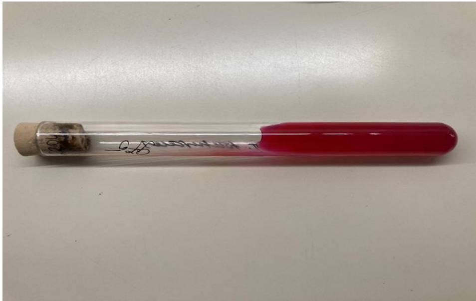
Slika 4. DTM agar, promjena boje medija iz žute u crvenu

Od poraslih kolonija izrađuju se mikroskopski preparati uz pomoć posebno oblikovanih žičanih eza, no na ovaj način nije uvijek moguće dobiti lijepu sliku. U tom je slučaju potrebno poraslu kulturu presijati na krumpirovu podlogu, PGA (engl. Potato Dextrose Agar ). PGA se priprema na način da 39 g baze ( Potato Dextrose Agar – Oxoid, Altrincham, Engleska) promiješa i otopi u 1 L vode, a nakon toga i sterilizira u autoklavu na 121 °C 15 min te prelije u petrijeve zdjelice (29). Ova podloga potiče stvaranje konidija i pigmenta i olakšava identifikaciju vrsta plijesni. Preparat za proučavanje mikromorfologije kolonija napravi se uz pomoć prozirnog selotejpa i laktofenola, LCB (engl. Lactophenol cotton blue). Za M.canis karakterističan je nalaz vretenastih makrokonidija debljeg i hrapavog zida sa karakterističnim završetkom u obliku kvržice. Makrokonidije imaju šest ili više odjeljaka (26).