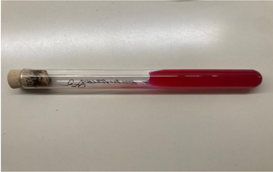
Slika 4. DTM agar, promjena boje medija iz žute u crvenu

Od poraslih kolonija izrađuju se mikroskopski preparati uz pomoć posebno oblikovanih žičanih eza, no na ovaj način nije uvijek moguće dobiti lijepu sliku. U tom je slučaju potrebno poraslu kulturu presijati na krumpirovu podlogu, PGA (engl. Potato Dextrose Agar ). PGA se priprema na način da 39 g baze ( Potato Dextrose Agar – Oxoid, Altrincham, Engleska) promiješa i otopi u 1 L vode, a nakon toga i sterilizira u autoklavu na 121 °C 15 min te prelije u petrijeve zdjelice (29). Ova podloga potiče stvaranje konidija i pigmenta i olakšava identifikaciju vrsta plijesni. Preparat za proučavanje mikromorfologije kolonija napravi se uz pomoć prozirnog selotejpa i laktofenola, LCB (engl. Lactophenol cotton blue). Za M.canis karakterističan je nalaz vretenastih makrokonidija debljeg i hrapavog zida sa karakterističnim završetkom u obliku kvržice. Makrokonidije imaju šest ili više odjeljaka (26).