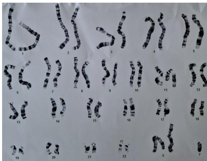
Slika 2. Kariogram – KS

Klinefelterov sindrom (KS) je najčešća aneuploidija spolnih kromosoma kod muškaraca s procijenjenom prevalencijom od otprilike 1:650 muških novorođenčadi (14,15). Kariotip 47,XXY nastaje zbog nedisjunkcije kromosoma, zbog očinske nedisjunkcije u prvoj mejotičkoj diobi (50 %), ili zbog majčinske nedisjunkcije u prvoj ili drugoj mejotičkoj podjeli ili tijekom postzigotne podjele (50 %) (3). Većina slučajeva (90 %) predstavlja čisti oblik s kariotipom 47,XXY, dok preostalih 10 % uključuje sljedeće kromosomske abnormalnosti: mozaicizam (46,XY/47,XXY), aneuploidije višeg stupnja (48,XXXY; 49,XXXXY) i strukturno abnormalne X kromosome (14). 50 % prekobrojnih X kromosoma je porijeklom od majke te se smatra kako se češće javlja u djece starijih očeva ili starijih majki (9,16).