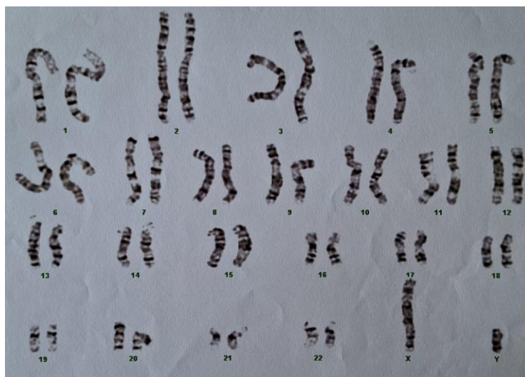
Slika 5. Kariogram – sindrom androgene neosjetljivosti

Samo potonji je odgovoran za potpuno razvijeni vanjski ženski reproduktivni sustav kod pacijenata s 46,XY kariotipom (32).