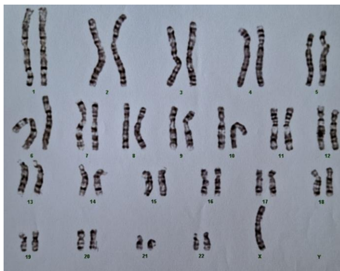
Slika 1. Kariogram – TS

Turnerov sindrom (TS) uzrokovan je djelomičnim ili potpunim nedostatkom drugog X kromosoma kod žene, što rezultira razvojem izrazito varijabilnog genotipa i kliničkog fenotipa (4). Jedina je monosomija koja je kompatibilna sa životom i javlja se kod otprilike 1 od 2000 novorođenih djevojčica (5). Kod žena s TS-om, X kromosom je u 60 % - 80 % slučajeva maternalnog podrijetla, a očinskog je podrijetla u 15 % - 35 % slučajeva, dok je u preostalim slučajevima uzrok nedostatka jednog X kromosoma, postzigotni gubitak X kromosoma (4). Približno 45 % pacijenata s TS-om ima tipičan kariotip 45,X, 15 % - 25 % ima mozaični oblik s kariotipom 45,X/46,XX, a otprilike 3 % ima kariotip 45,X/46,XY (6,7). Strukturne promjene na X kromosomu mogu se naći u 20 % slučajeva (7).