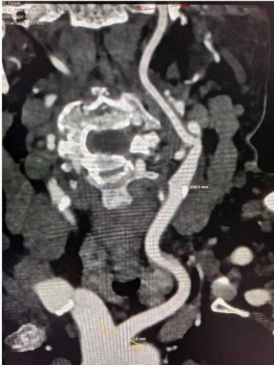
Slika 2: mjerenje duljine 1, stvarne duljine arterijskog segmenta