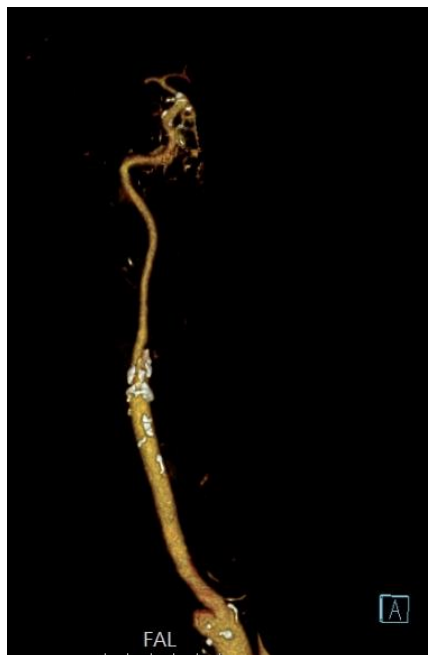
Slika 4: ravno karotidno stablo

Morfologija karotidnog stabla klasificirala se prema tome je li tortuozno ili nije. Ravnim karotidnim stablom smatralo se ono kojemu je kut između središnjih linija zajedničke karotidne arterije i unutarnje karotidne arterije bio manji od 15^\circ (Slika 4).