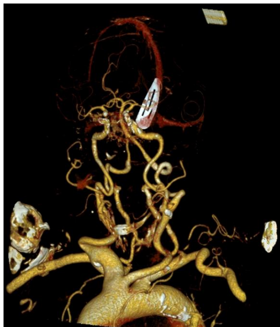
Slika 1: CT angiografija pacijentice s bovinim lukom aorte sa zajedničkim ishodištem truncusa brachiocephalicusa i lijeve zajedničke karotidne arterije.

Zajedničke karotidne arterije daju dva glavna ogranka, unutarnju i vanjsku karotidnu arteriju. Vanjska karotidna arterija opskrbljuje ekstrakranijske strukture glave i vrata, dok unutarnja karotidna arterija ulazi u lubanju kroz karotidni kanal i opskrbljuje krvlju intrakranijske strukture. Unutarnja karotidna arterija ima nekoliko ogranaka u svom intrakranijskom toku, a završava s dva terminalna ogranka, prednjom moždanom arterijom i srednjom moždanom arterijom, koje zajedno sa stražnjom moždanom cirkulacijom formiraju Willisov krug. Srednja moždana arterija podijeljena je u četiri segmenta: M1 (sfenoidalni), M2 (inzularni), M3 (operkularni) i M4 (kortikalni).