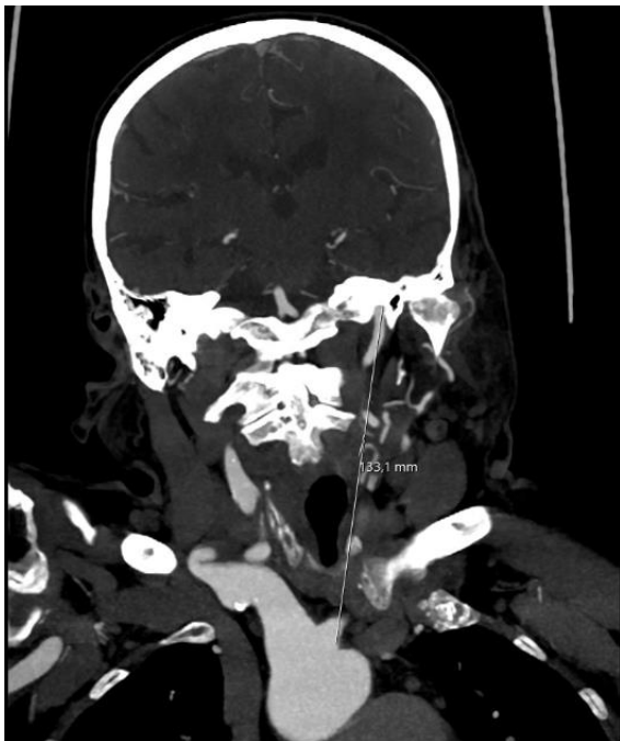
Slika 3: mjerenje duljine 2, pravocrtne udaljenosti od mjesta odvajanja lijeve zajedničke karotidne arterije ili truncusa brachiocephalica od luka aorte