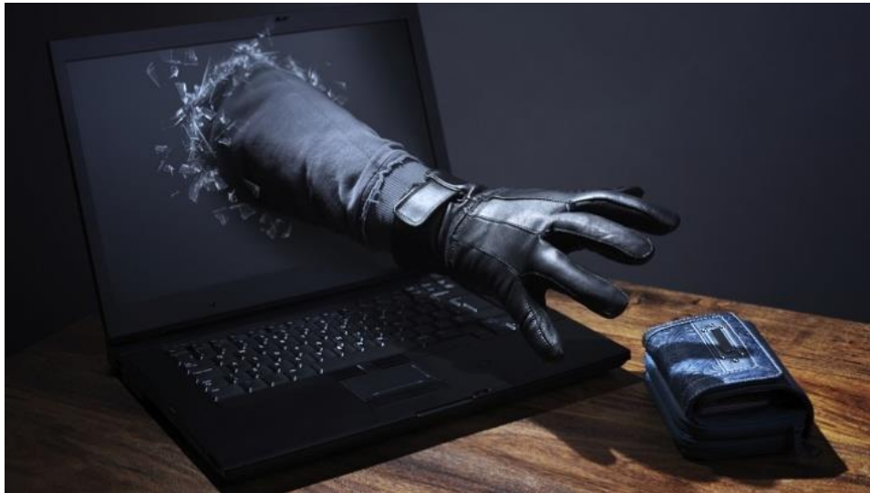
Slika 1.: Internet krađa