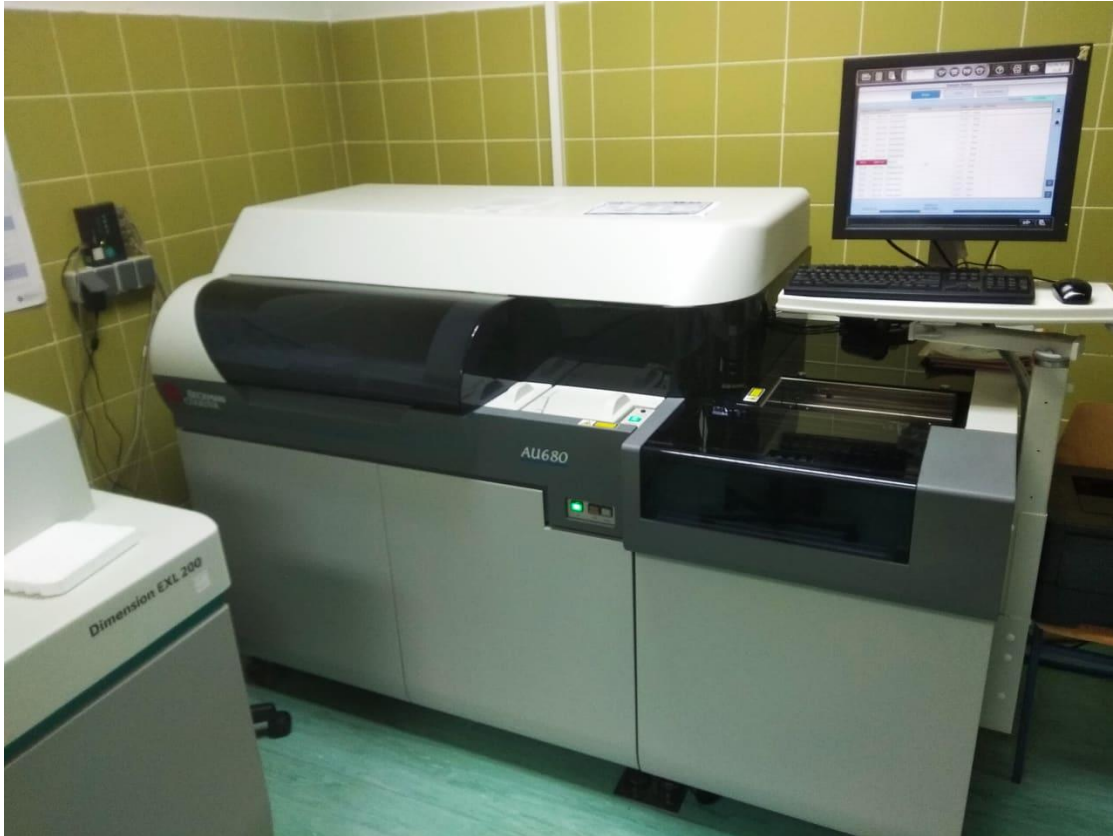
Slika 3. Beckman Coulter AU680 uređaj

Princip metode određivanja HbA1c u krvi: HbA1c određuje se u punoj krvi koja je prikupljena u epruvetu s ljubičastim čepom u kojoj se nalazi antikoagulans etilendiamintetraoctena kiselina (EDTA). HbA1c određen je imunoturbidimetrijskom metodom na instrumentu Dimension ExL (Slika 4.), tvrtke Siemens, također koristeći njihov reagens. Dimension uređaj mjeri i HbA1c i ukupni hemoglobin. Kod mjerenja ukupnog hemoglobina, uzorak pune krvi dodaje se u kivetu u kojoj se nalazi lizirajući reagens. Taj reagens lizira eritrocite i tako omogućuje izlazak hemoglobina iz eritrocita. Zatim se alikvot lizirane krvi prebacuje u drugu kivetu u kojoj se mjeri koncentracija ukupnog hemoglobina spektrofotometrijski na 405 i 700 nm. Za mjerenje HbA1c koristi se isti alikvot lizirane pune krvi kao i kod mjerenja ukupnog hemoglobina. U drugoj kiveti nalazi se anti-HbA1c antitijelo s kojim HbA1c stvara topljivi antigen-antitijelo kompleks. Zatim se u kivetu dodaje polihapten reagens s epitopima za HbA1c. Polihapten reagira sa suviškom anti-HbA1c antitijelima i stvara netopive komplekse koji se mjere turbidimetrijski na valnoj duljini 340 nm. Koncentracija HbA1c izražava se kao omjer HbA1c i koncentracije ukupnoga hemoglobina.