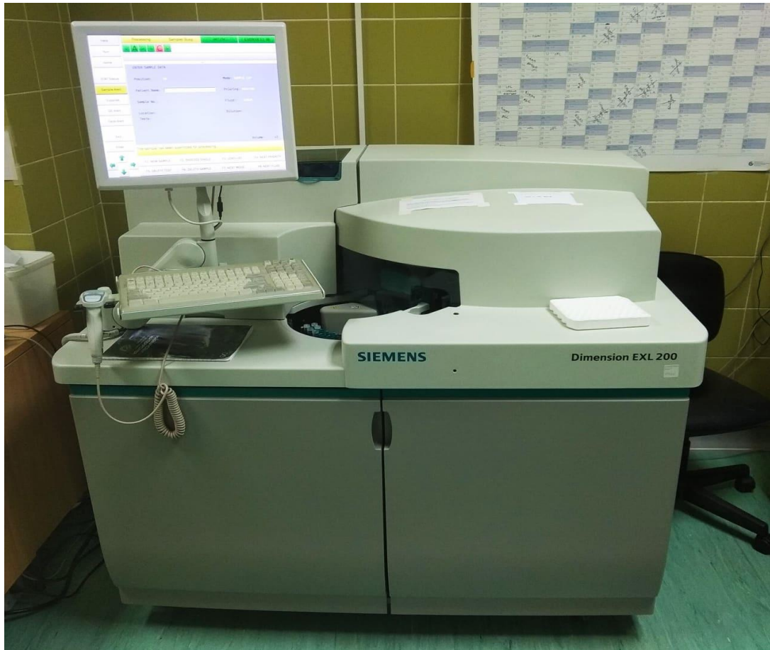
Slika 4. Dimension ExL uređaj, tvrtke Siemens

Princip metode određivanja albumina u urinu: Imunoturbidimetrijskom metodom određen je albumin u uzorku urina na instrumentu Beckman Coulter AU680 i uz reagens Tina-quant MAU, Roche Diagnostics . (Slika 3.) Imunoturbidimetrijska metoda temelji se na reakciji između albumina iz uzorka i antitijela albumina antihumanog seruma. Tako nastaju imuni kompleksi koji raspršuju svjetlost, a zatim se mjeri promjena apsorbancije na 380 nm, koja je proporcionalna koncentraciji albumina u uzorku.