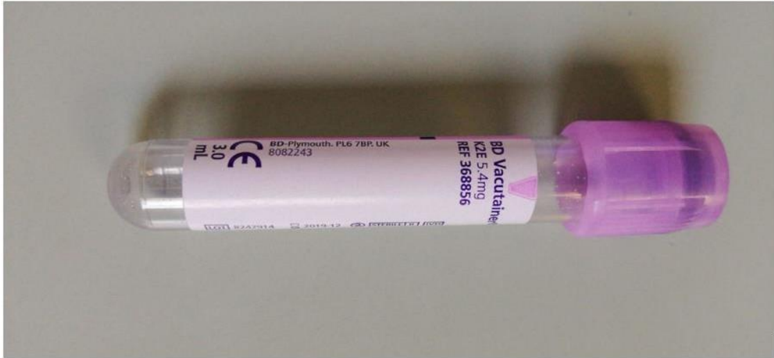
Slika 2. Epruveta za imunohematološke pretrage

Materijali koji se koriste za IAT, odnosno analizatore Tango Optimo (slika 3) i Tango Infinity (Slika 4) jesu: