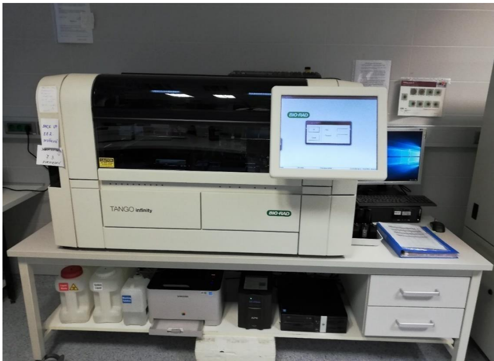
Slika 4. Tango Infinity