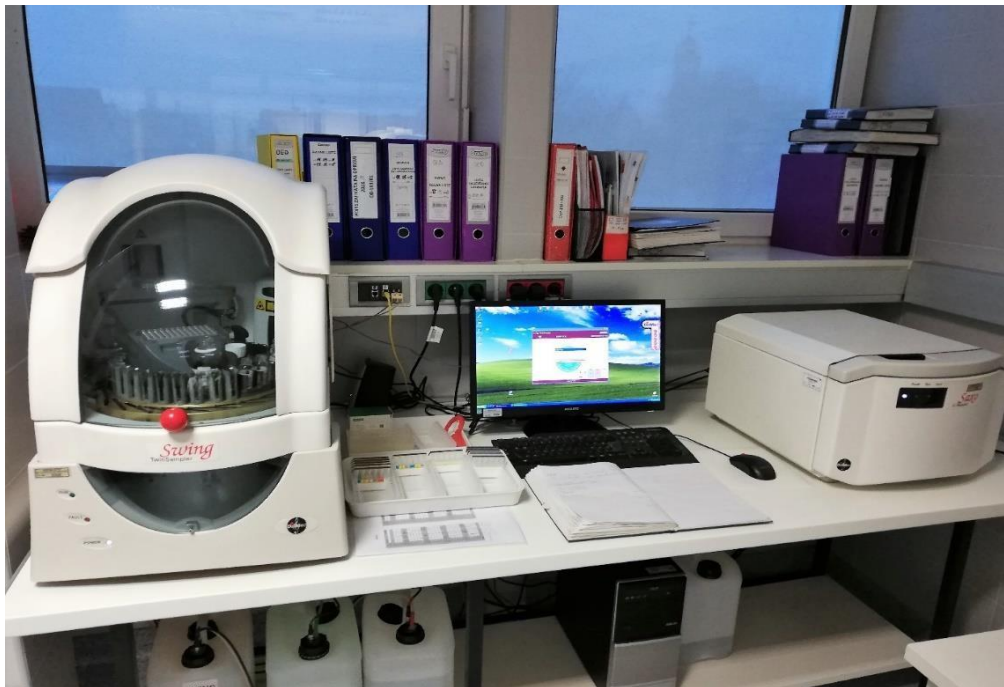
Slika 5. Twin sampler Swing