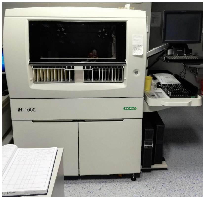
Slika 6. IH-1000