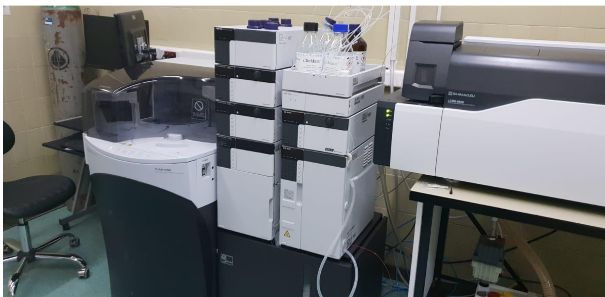
Slika 4. Prikaz uređaja NEXERA X2 HPLC koji je povezan sa LCMS-8050.