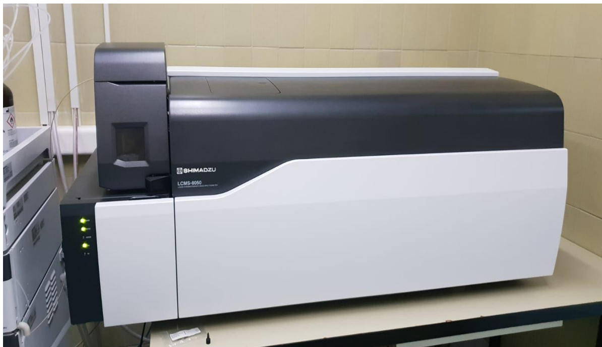
Slika 3. Uređaj LCMS-8050, Shimadzu.