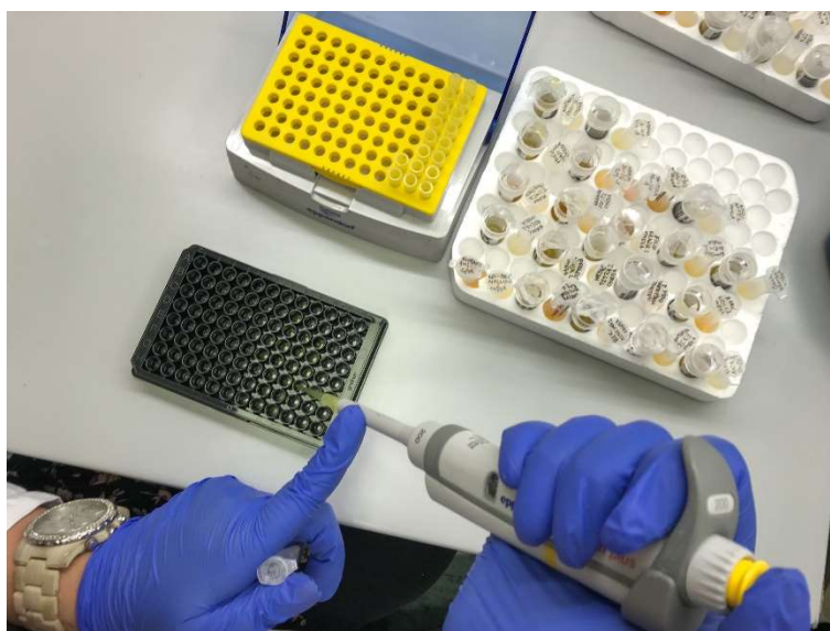
Slika 4. Pipetiranje uzoraka seruma na crnu ploču s 96 jažica