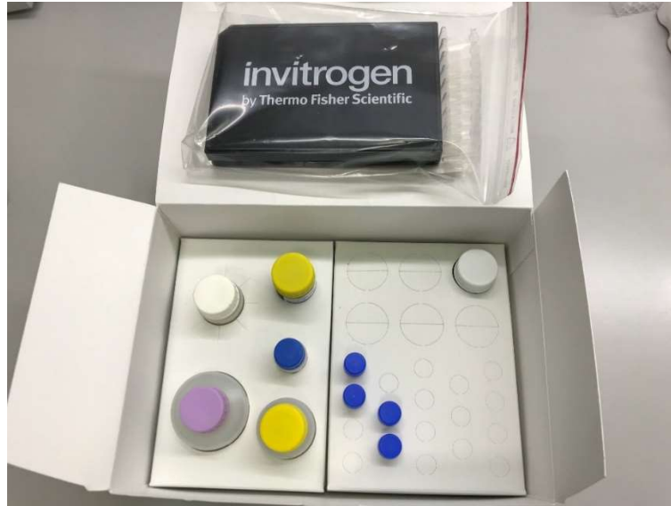
Slika 2. Sadržaj humanog ProcartaPlex™ kita

1 bocu univerzalnog pufera za ispitivanje, 1 bočicu razrjeđivača protutijela za detekciju, traku od 8 cijevi, magnetnu podlogu, te crnu ploču s ravnim dnom s 96 jažica (Slika 2. i 3.) (25).