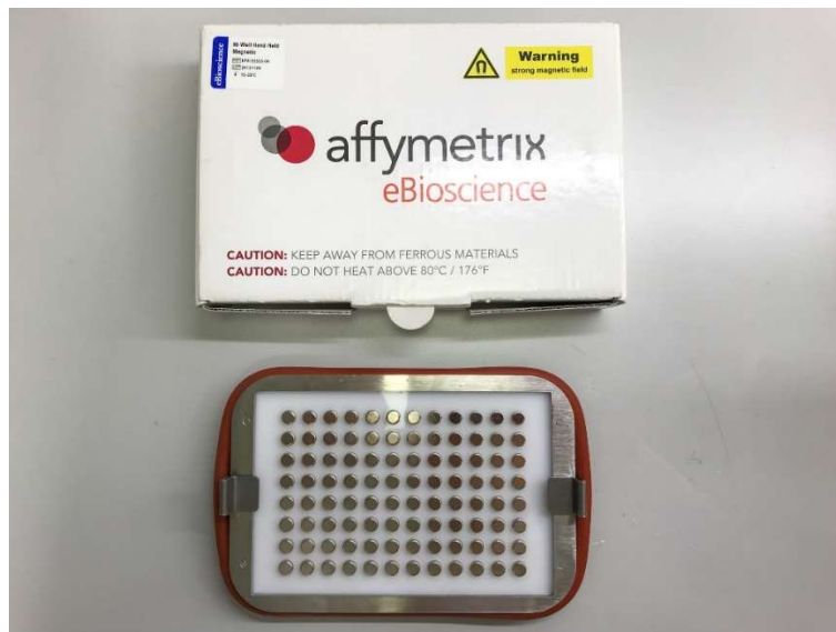
Slika 3. Magnetna podloga za crnu ploču s jažicama