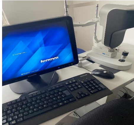
Slika 1.1. Uređaj LENSTAR 900 ® , Haag Streit

Također, IOL Master 700 ® Swept Source OCT Biometry ® je suvremeni uređaj za mjerenje biometrijskih obilježja oka koji omogućuje brzo i precizno mjerenje aksijalne duljine oka, zakrivljenosti rožnice, dubine prednje očne sobice, debljine leće i rožnice te horizontalni promjer rožnice. Posjeduje softverski set s formulama i konstantama (tvornički zadanim parametrima) za izračun dioptrije umjetne intraokularne leće, što je iznimno važno ako je pacijent prije operativnog zahvata katarakte laserski korigirao vid ili je visoko kratkovidan. Uređaj izračunava jakost u dioptrijama intraokularne leće, bez obzira na to je li oko fakično – s prirodnom lećom, afakično – bez leće, ili je pak planirana ugradnja refraktivnih fakičnih leća radi korekcije dioptrije.