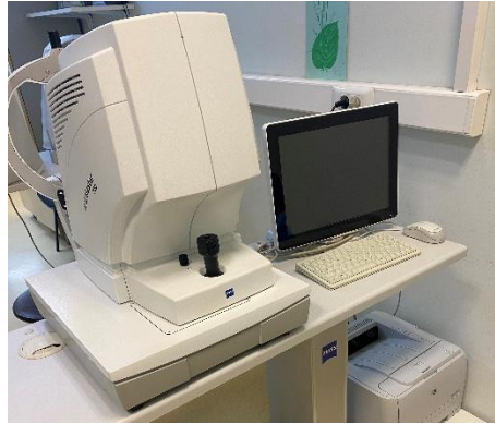
Slika 1.2. Uređaj IOL Master 700 ® Swept Source OCT Biometry ® (fotografirala autorica)