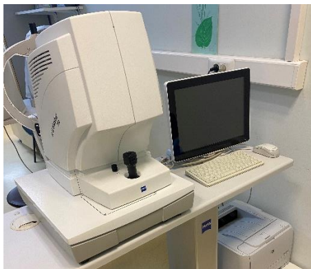
Slika 1.2. Uređaj IOL Master 700 ® Swept Source OCT Biometry ®