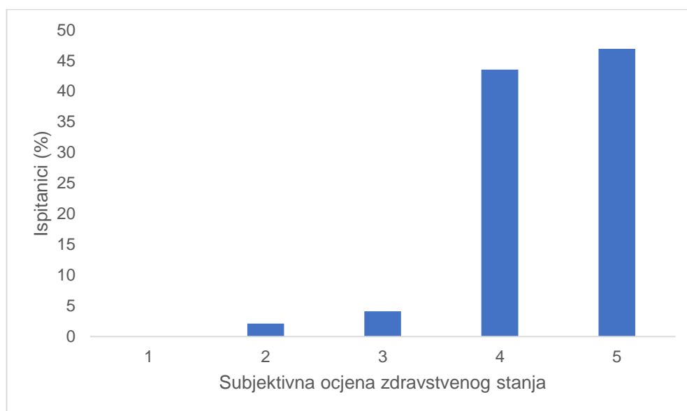
Slika 5. 1. Raspodjela ispitanika prema subjektivnoj ocjeni zdravstvenoga stanja

Osjećaju li se zdravo ispitanici su ocijenili na skali od 1 do 5, gdje niže ocjene upućuju na lošiju subjektivnu ocjenu zdravstvenoga stanja. Medijan skale je 4 (interkvartilnoga raspona od 4 do 5), a raspon ocjena je od 2 do 5 (Slika 5.1).