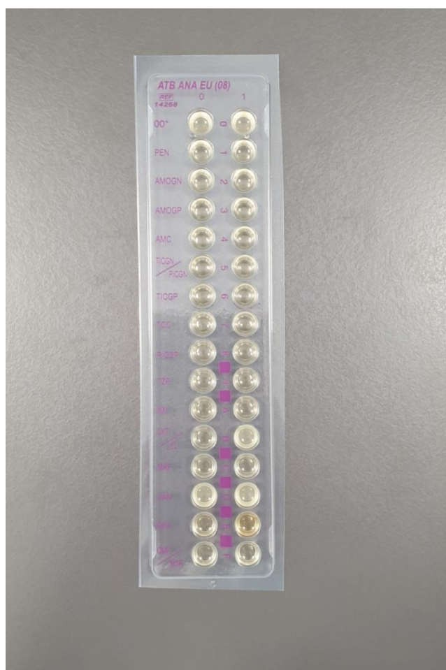
Slika 1. Komercijalno dostupan sustav (ATB ANA, Biomerieux, France) za ispitivanje osjetljivosti metodom prijelomne točke

Ispitivanje osjetljivosti anaerobnih bakterija provodi se i metodom prijelomne točke ( breakpoint ). Ova je metoda modificirani oblik dilucijske metode u bujonu. U jažicu se prenosi suspenzija koja je prethodno načinjena od određene koncentracije antibiotika i bakterije koju želimo testirati (Slika 1). Koncentracija antibiotika predstavlja „prijelomnu točku“ za određivanje je li bakterija osjetljiva ili otporna. Ukoliko je bakterija osjetljiva na antibiotik u jažici neće doći do zamućenja, odnosno porasta bakterije. Ukoliko je MIK (minimalna inhibitorna koncentracija) manji ili jednak osjetljivosti prijelomne točke, bakterija se smatra osjetljivom na antibiotik. Metoda se primjenjuje u rutinskom radu u laboratoriju.