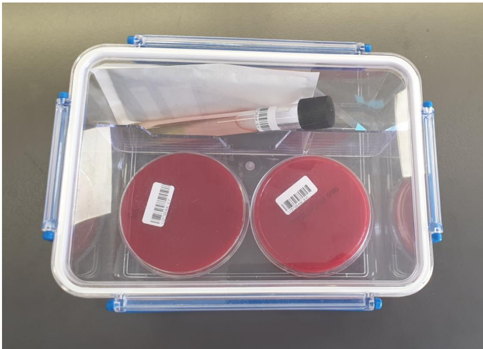
Slika 2. Aparatura potrebna za uzgoj anaerobnih bakterija: lonac za anaerobne uvjete, Columbia agar, SNVS agar, tioglikolatni bujon, indikator atmosfere i generator atmosfere

Nakon inkubacije očitani su test osjetljivosti i određen MIK.