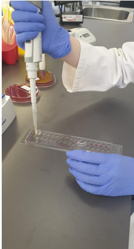
Slika 3. Izrada ATB ANA, Biomerieux, France za ispitivanje osjetljivosti anaerobnih bakterija

Bitno je napraviti i kontrolni test aerotolerancije, odnosno kontrolu čistoće izvedbe testa iz 3 McF medija i ATB S medija na način da se Columbia agar potom izloži anaerobnim uvjetima, a krvni agar aerobnim uvjetima. Kontrolni test aerotolerancije je zadovoljen ukoliko je došlo do porasta bakterija na Columbia agaru, ali ne i na krvnom agaru. Time je potvrđeno kako se radi o anaerobnoj bakteriji.