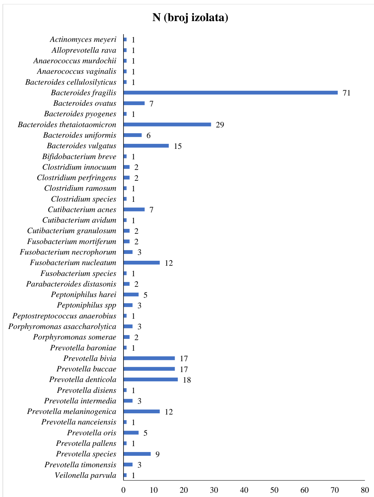
Slika 6. Izolirane anaerobne vrste bakterija u periodu 18.5.2020. – 18.5.2022.