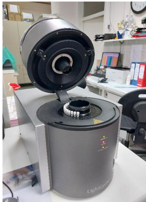
Slika 3. Uređaj LightCycler® 1.2 (Roche Diagnostics Ltd., Švicarska)

Genotipizacija HFE izvođena je pomoću uređaja LightCycler® 1.2 Real time PCR System (Roche Diagnostics Ltd., Švicarska) (Slika 3.).