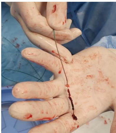
Slika 2 - Slika ugruška u stent retrieveru, izvađenog postupkom mehaničke trombektomije (fotografirala autorica rada).

MT u liječenju AIMU-a indicirana je kod pacijenata dobi \geq 18 godina s okluzijom velike krvne žile, premorbidnim mRS-om 0 ili 1, NIHSS-om \geq 6 , ASPECTS \geq 6 te u vremenskom okviru od 6 sati od nastupa simptoma (19). No, indikacije za MT se progresivno proširuju pa se tako provedbom dviju studija, DEFUSE-3 (engl. Endovascular Therapy Following Imaging Evaluation for Ischemic Stroke 3 ) i DAWN (engl. Diffusion-Weighted Imaging [DWI] or CTP Assessment With Clinical Mismatch in the Triage of Wake-Up and Late Presenting Strokes Undergoing Neurointervention With Trevo ), terapijski okvir od 6 sati se proširio na 16, odnosno 24 sata od nastupa simptoma kod pacijenata s okluzijom velike krvne žile (LVO, prema engl. Large vessel occlusion ) anteriorne cirkulacije koji zadovoljavaju dodatne slikovne dijagnostičke kriterije. Uspješnost rekanalizacijskog liječenja postupkom MT-a može se procijeniti mTICI (modificirana ljestvica za uspjeh reperfuzije, prema engl. Modified treatment in cerebral ischemia score ) bodovnom ljestvicom, a cilj MT-a je uspostaviti 2b - 3 razinu reperfuzije prema mTICI bodovnoj ljestvici (20) (Tablica 1).