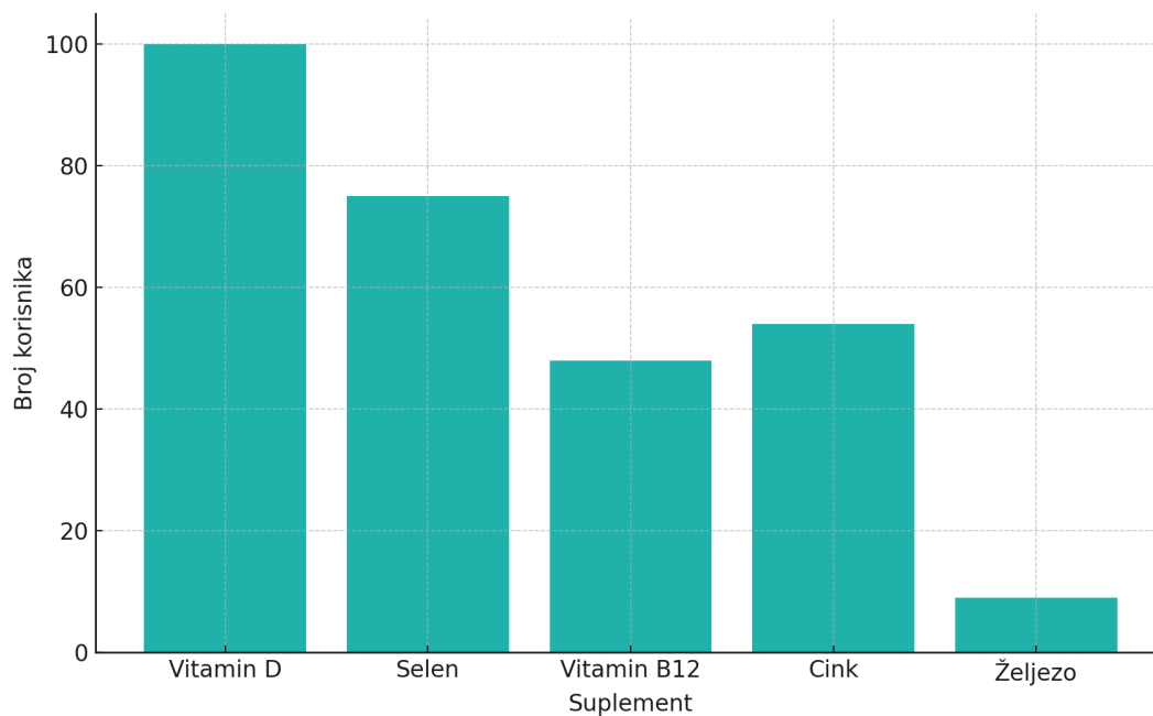
Slika 1. Raspodjela korištenja suplemenata među ispitanicima

Kvaliteta života se procijenila upitnikom SF-36 ocjenskom skalom od 0 do 100, gdje veći broj ukazuje na bolju kvalitetu (Tablica 4)(Slika 2).