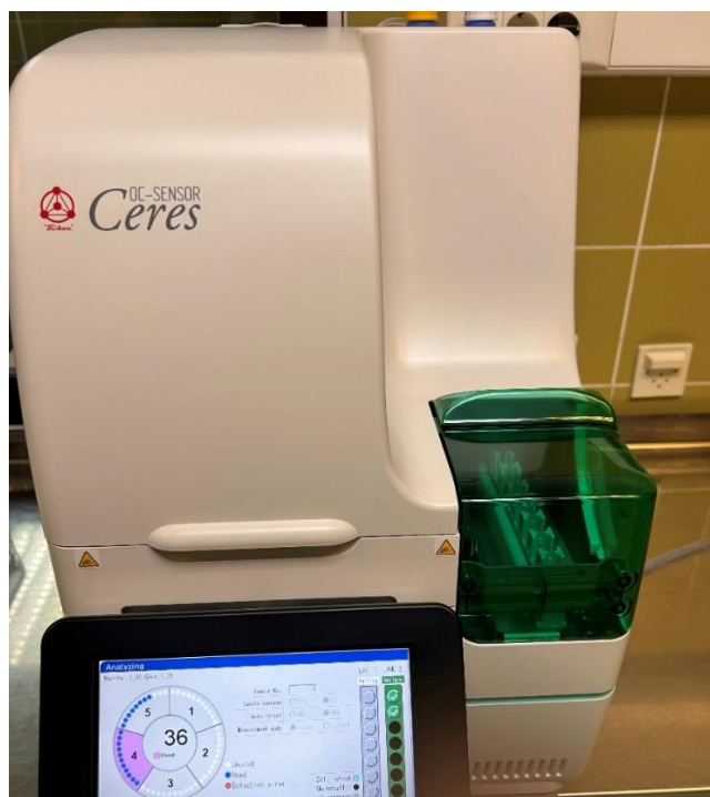
Slika 2. Automatski analizator OC SENSOR Ceres