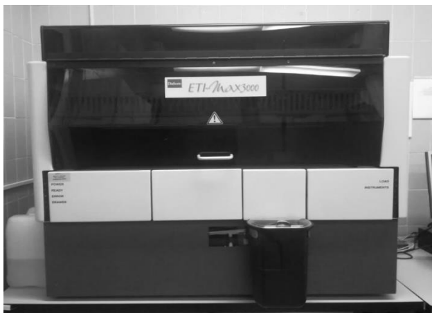
Slika 4.3. ELISA procesor EtiMax 3000