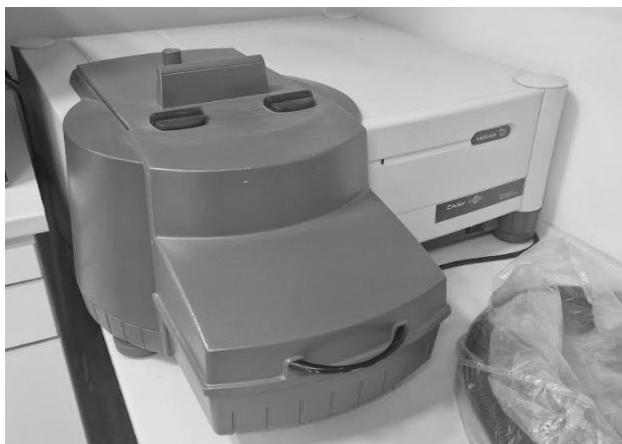
Slika 4.2. Fluorescentni spektrofotometar Cary Eclipse