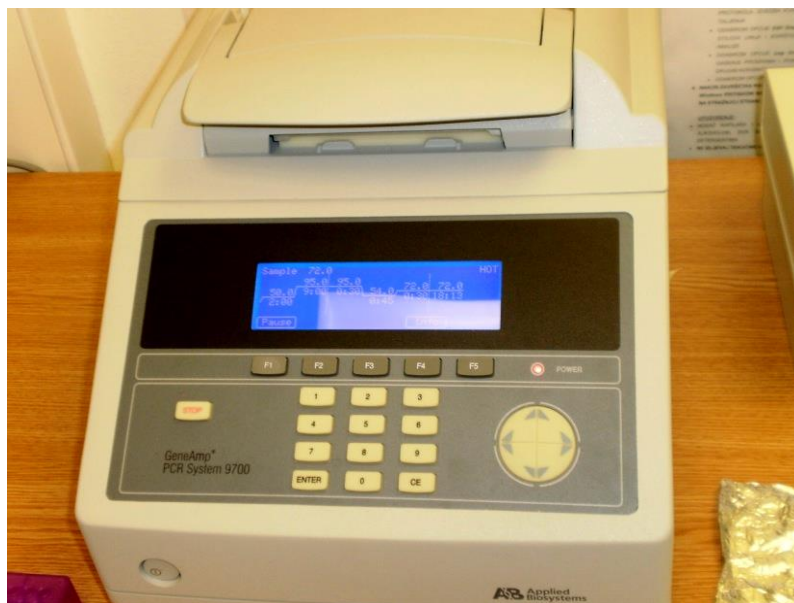
Slika 4. PCR uređaj (GeneAmp PCR System 9700 sa zlatnim blokom)