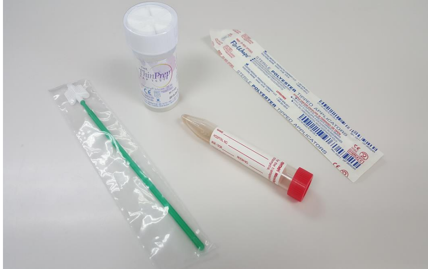
Slika 1. Medij za uzorkovanje HPV-a