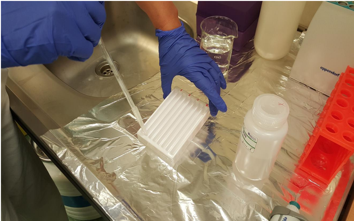
Slika 6. Vakumska aspiracija pufera dodanog u kadicu s genotip-trakicama