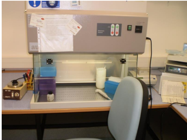
Slika 2. Biokabinet za sterilni rad laboratorij za molekularnu dijagnostiku mikroorganizama

8. Pripremljena mikrocentrifugalna tubica sadržavala je eluiranu, pročišćenu DNA koja se mogla odmah koristiti ili skladištiti na -20°C do daljnje upotrebe.