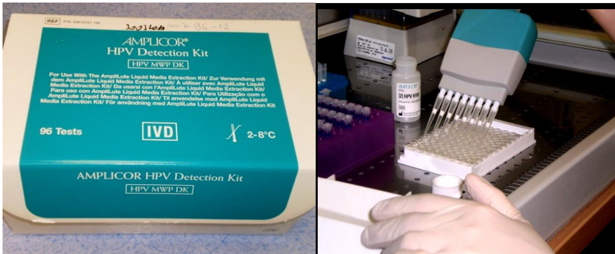
Slika 3. AMPLICOR Human Papilloma Virus (HPV) test koji pomoću PCR reakcije otkriva 13 visokorizičnih HPV-genotipova najčešće povezanih s rakom vrata maternice