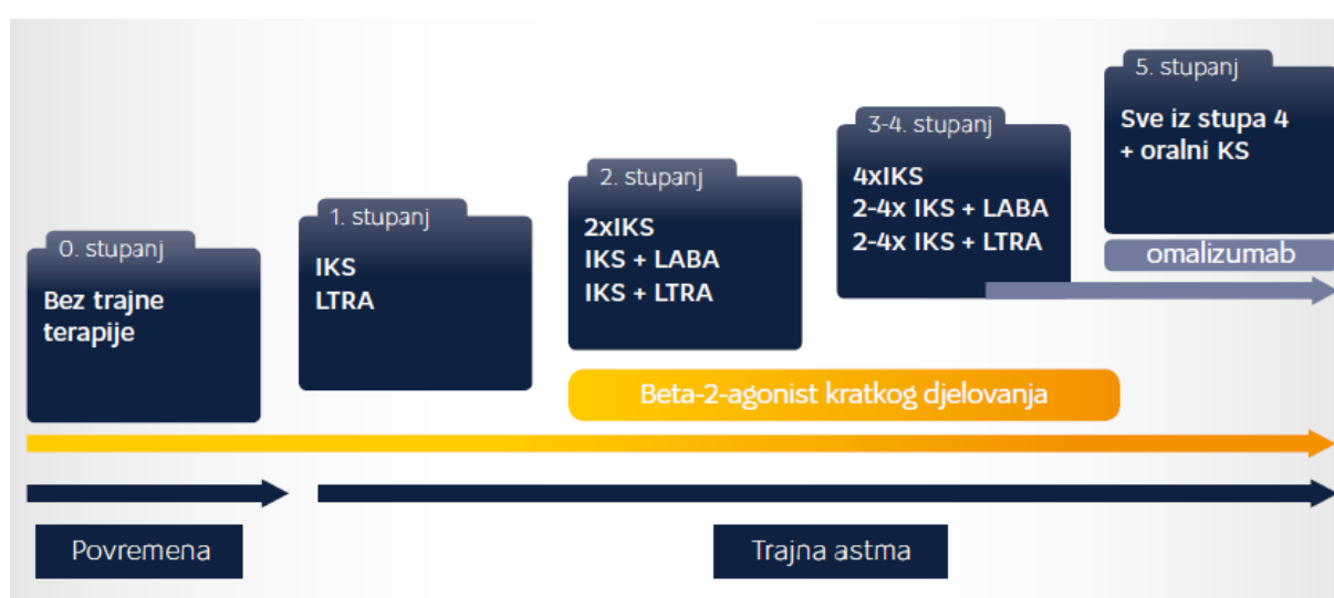
Slika 1. Stupnjeviti pristup liječenju astme

specifičnim indikacijama preporučiti liječenje omalizumabom (anti-IgE-monoklonsko protutijelo). U svakom stupnju težine bolesti kao prva terapijska opcija za liječenje astme preporučuje se beta-2-agonist kratkog djelovanja (salbutamol). Ostale mjere liječenja poput kontrole okoliša, provođenje edukacije, te provjeru adherencije potrebno je provoditi u svim stupnjevima, osobito kada se terapija povisuje na viši stupanj. Kod bolesnika s lošom kontrolom astme potrebno je provjeriti postoje li pridružene bolesti kao što su alergijski rinitis ili gastroezofagealni refluks. Nakon određenog perioda liječenja u slučaju dobre kontrole astme može se preporučiti terapija nižeg stupnja, kako bi se smanjilo opterećenje lijekovima, a tako i rizik od nuspojava.