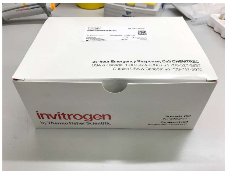
Slika 1. Humani ProcartaPlex™ kit

Ispitanicima je prvoga i posljednjega dana trodnevnoga protokola uzorkovana venska krv uvođenjem braunile u svrhu dobivanja seruma. Uzorak venske krvi uzorkovan je nakon pola sata mirovanja u mirnoj i tihoj prostoriji. Vrijednosti biljega upale i aktivacije endotela, odnosno interferon gama (INF- \gamma ), tumor-nekrotizirajući faktor alfa (TNF- \alpha ), interleukini 6, 9, 10, 17A, 21, 22, 23, međustanična adhezijska molekula 1 (sICAM-1), krvožilna adhezijska molekula 1 (sVCAM-1), faktor-1 alfa deriviran iz stromalnih stanica (SDF-1 \alpha ), peptid povezan s latencijom (LAP), vaskularni endotelni faktor rasta A (VEGF-A), te vaskularni endotelni faktor rasta D (VEGF-D) izmjereni su putem ProcartaPlex Multiplex Immunoassay sustava. Invitrogen ProcartaPlex Multiplex (Slika 1.) imunološki testovi koriste tehnologiju Luminex xMAP (eng. multianalyte profiling ) kako bi omogućili istodobno detekciju i kvantifikaciju više proteina u jednom uzorku od 25 \mu L seruma. Kombinira se efikasnost višestruke kvantifikacije s preciznošću, osjetljivošću, ponovljivošću i jednostavnošću ELISA (engl. the enzyme-linked immunosorbent assay ) testa (25).