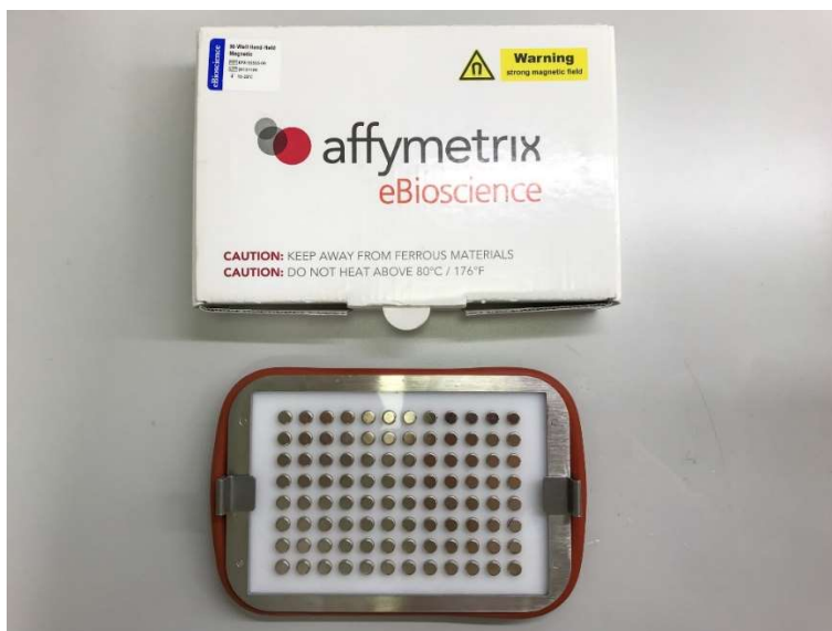
Slika 3. Magnetna podloga za crnu ploču s jažicama