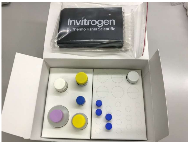
Slika 2. Sadržaj humanog ProcartaPlex™ kita

1 bocu univerzalnog pufera za ispitivanje, 1 bočicu razrjeđivača protutijela za detekciju, traku od 8 cijevi, magnetnu podlogu, te crnu ploču s ravnim dnom s 96 jažica (Slika 2. i 3.) (25).