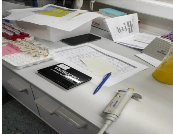
Slika 1. Postupak pripreme uzoraka.