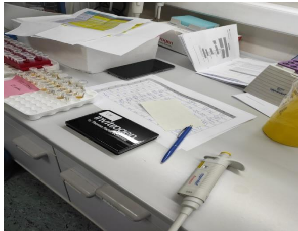
Slika 1. Postupak pripreme uzoraka.