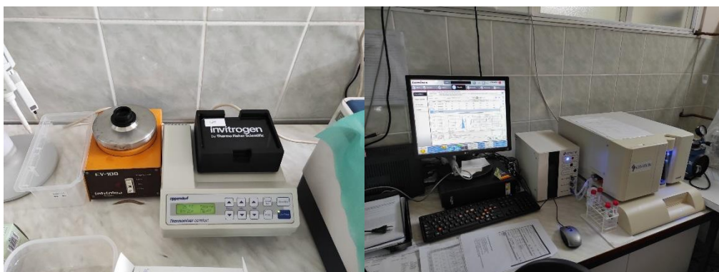
Slika 3. Postupak mjerenja serumske koncentracije proupalnih i protuupalnih citokina korištenjem ProcartaPlex Multiplex Immunoassay testova te metode temeljene na tehnologiji LuminexMAP (engl. multi-analyte profiling) .