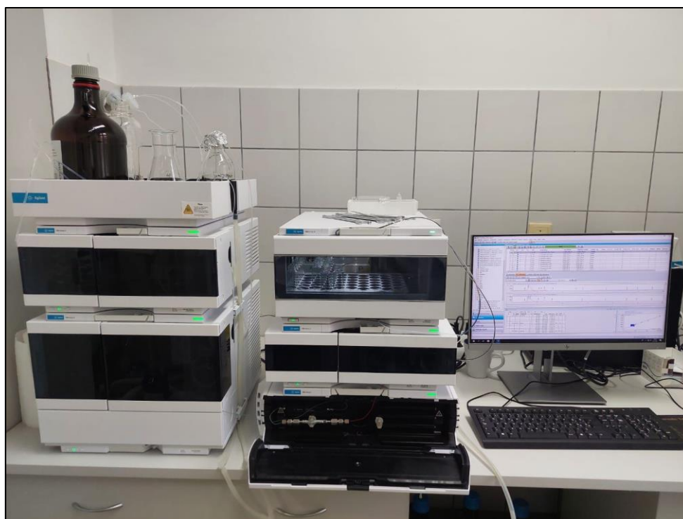
Slika 2. HPLC uređaj; Agilent technology 1260 Infinity II Prehrambeno tehnološki fakultet Osijek

Za određivanje koncentracije umjetnog zaslađivača acesulfama K u nabavljenim OBP-ima koristila se visokotlačna tekućinska kromatografija s detektorom niza dioda (HPLC/DAD, engl. High Performance Liquid Chromatography With Diode Array Detector ) (5, 29). Priprema uzorka za analizu uključivala je prebacivanje par mililitara soka u odgovarajuće staklene vijalice od 10 ml, degaziranje kroz 10 minuta na ultrazvučnoj kupelji Elma, Elmasonic P 120 H te filtriranje preko 0,2 \mu\text{m} najlon, filtera za HPLC i šprice. Na taj način pripremljeni uzorci prebačeni su u odgovarajuće vijalice za HPLC analizu te su automatski injektirani u uređaj. Kvalitativnom analizom je utvrđen umjetni zaslađivač acesulfam K, dok je kvantitativnom određena koncentracija ovoga analita. Identifikacija i kvantifikacija acesulfama K odrađena je nakon kalibracije radnih standarda unutar mjernog područja. Standard acesulfama K bio je HPLC čistoće te nabavljen od proizvođača Dr. Ehrenstorfer dok su sva korištena otapala nabavljena od proizvođača J. T. Baker (SAD). Određivanje koncentracije umjetnog zaslađivača acesulfama K provedeno je na HPLC uređaju (Agilent technology 1260 Infinity II) koji se sastoji od kvarterne pumpe, autosamplera, termostatisane kolone i DAD (Slika 2).