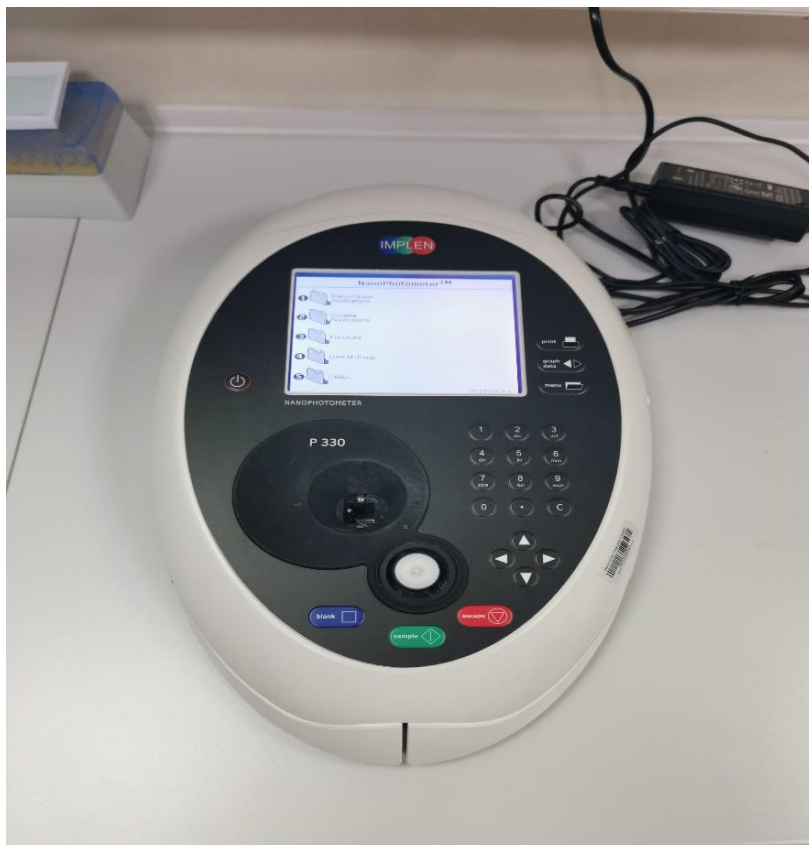
Slika 1. Uređaj za mjerenje čistoće koncentracije RNA - spektrofotometar IMPLEN

ispipetiran 75 % etanol i stavljen u centrifugu na 7500 RFC, 5 minuta. Kako bismo dobili najčišću moguću RNA taj postupak smo napravili dva puta. Na pročišćeni uzorak dodano je 40 \mu L Nuclease-Free Water otopine. Nakon izolacije mRNA, koncentracija je očitana pomoću IMPLENA, nanofotometra i uzorci su spremljeni u hladnjak.