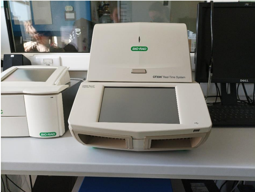
Slika 2. Uređaj lančane reakcije polimeraze - BioRad CFX96

raširena i uobičajena metoda koja se koristi u svim medicinskim-biološkim laboratorijima, a koristi se za otkrivanje gena, ekspresiju gena ili pomaže identificirati patogen u infekciji.