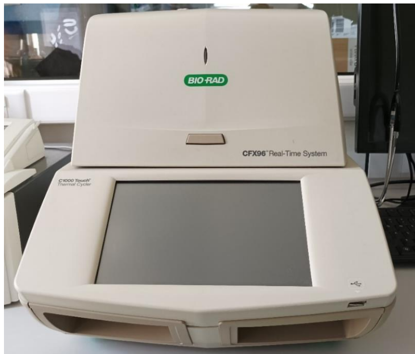
Slika 1. Uređaj CFX96 Real-Time System (Bio-Rad), Laboratorij za kliničku i molekularnu imunologiju Medicinskog fakulteta u Osijeku

Nakon ujednačavanja koncentracija proveden je DNAza tretman kako bi se osiguralo isključivo umnožavanje RNA. Za umnažanje RNA korištena je metoda RTqPCR na Bio-Rad Real Time PCR CFX96 uređaju. Reakcijska smjesa za PCR sadrži termostabilnu DNA polimerazu koja produljuje lanac, pufer, dNTP potrebne za produljivanje lanca, specifične početnice koje se vežu za DNA kalup čiji slijed nukleotida odgovara slijedu na genu za traženi adenzinski receptor, otopinu MgCl_2 i boju pomoću koje se detektira umnoženi DNA produkt.