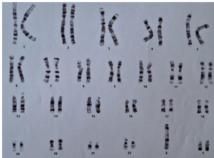
Slika 3. Kariogram – XYX sindrom

tijekom druge faze mejoze (22). Nedisjunkcija se može dogoditi i tijekom postzigotnog razvoja (2).