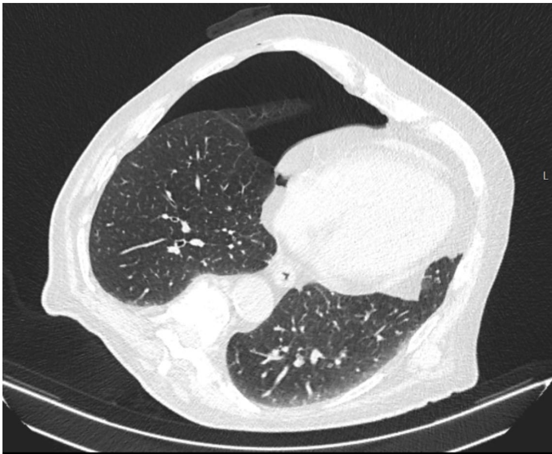
Slika 2. Aksijalni CT presjek kroz toraks pokazuje veći postintervencijski pneumotoraks.

Kako bi se na vrijeme detektirala ova komplikacija, pacijentima se kontrolni CT presjeci čine odmah po završetku uzorkovanja, čime se detektira rani pneumotoraks, a također se radi kontrolna konvencionalna radiografska snimka, obično 4 sata nakon uzorkovanja, čime se može pratiti eventualna regresija ili progresija već evidentiranog pneumotoraksa, ili detektirati odgođena pojava pneumotoraksa. Svrha detekcije i procjene pneumotoraksa je na vrijeme prepoznati ovu komplikaciju, te u slučaju potrebe postaviti torakalni dren za evakuaciju zraka iz pleuralnog prostora i reekspanziju pluća, čime se može spriječiti fatalni ishod (11). U slučaju nepostojanja pneumotoraksa, ili njegove adekvatne spontane regresije, asimptomatski pacijent može biti otpušten iz bolnice.