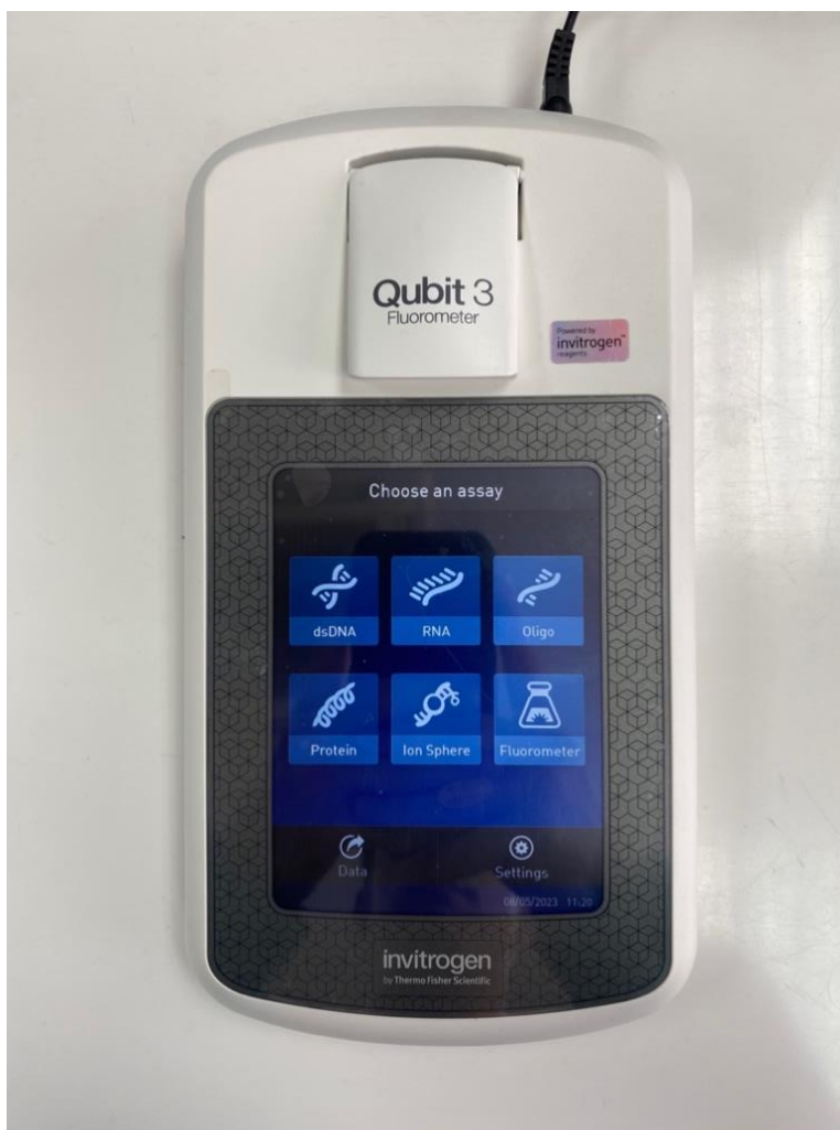
Slika 2. Qubit 3 Fluorometer (Thermo Fisher Scientific, Waltham, Massachusetts, SAD), uređaj za mjerenje koncentracije DNA, RNA i proteina u uzorcima.

Provjera koncentracije DNA provedena je prema protokolu proizvođača Thermo Fisher Scientific (31).