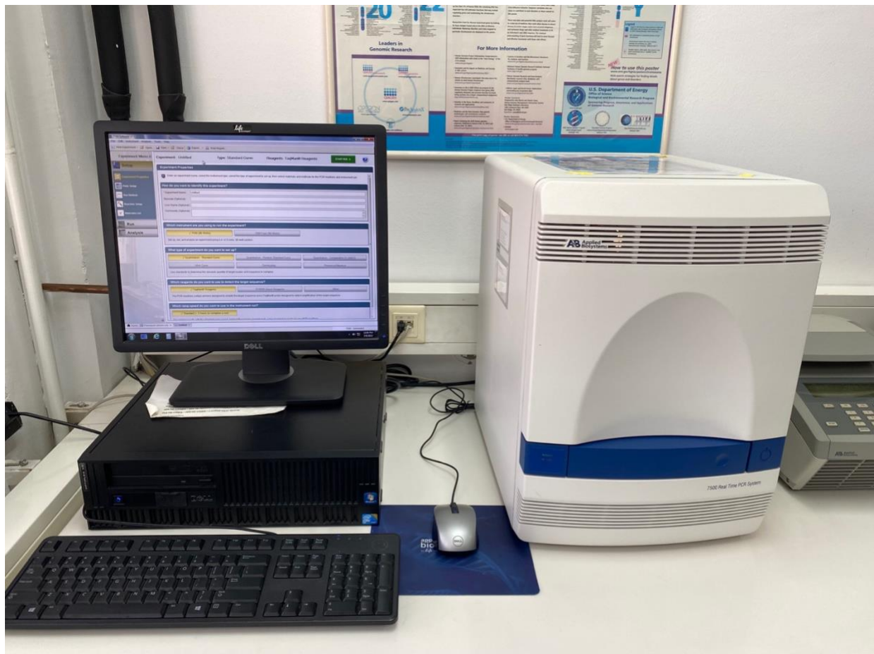
Slika 2. Uređaj Applied Biosystem 7500 Real Time PCR (Waltham, Massachusetts, SAD) proizvođača Thermo Fisher Scientific