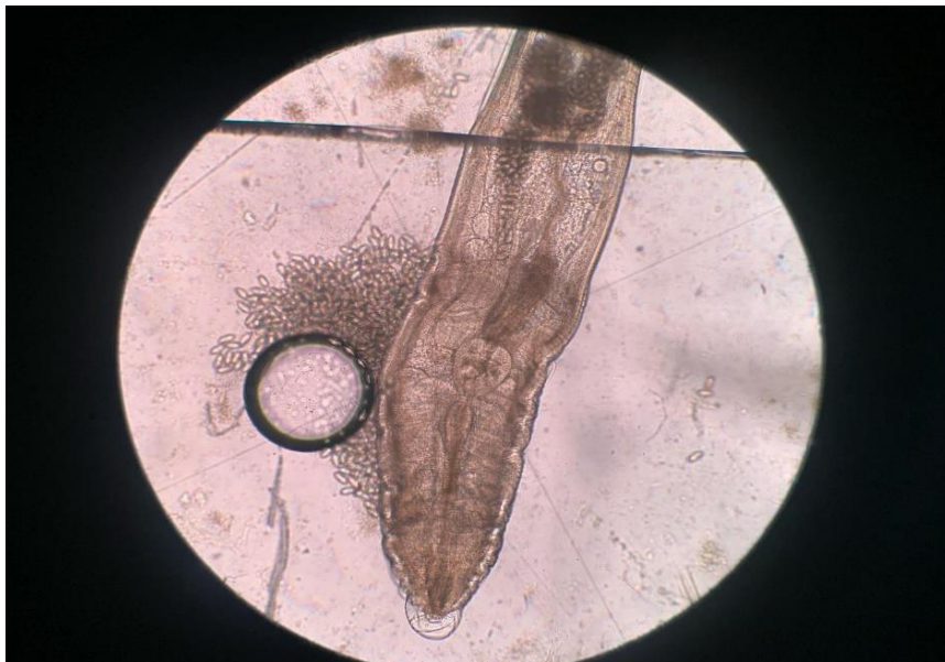
Slika 6. Adult i jaja E. vermicularis u uzorku stolice, povećanje 40x