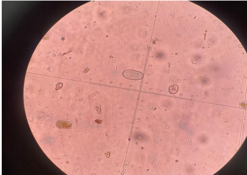
Slika 5. Jaje E. vermicularis u uzorku stolice, povećanje 40x

U uzorku stolice se ponekad mogu pronaći adulti E. vermicularis ili jaja na samoj površini stolice.