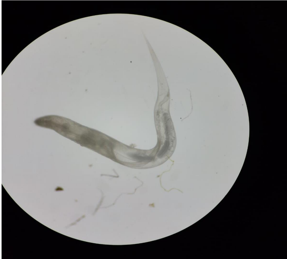
Slika 1. Adult, ženka E. vermicularis

Najčešći način zaraze je putem kontaminiranih prstiju koji dolaze u doticaj s usnom šupljinom odakle jaja lako dolaze do ostalih dijelova probavnog sustava. E. vermicularis ima jednostavni životni ciklus koji se odvija u gastrointestinalnom lumenu. Nakon što se dva puta linjaju, pare se i kreću migrirati prema debelom crijevu. Najviše parazitiraju u cekumu, ali se mogu pronaći i u ostalim dijelovima debelog crijeva. Ženke žive do 100 dana i u tom razdoblju dospijevaju u analni kanal gdje liježu jaja, dok mužjaci ugibaju ubrzo nakon kopulacije. Oko 2 – 6 tjedna nakon ingestije jaja, gravidne ženke migriraju u perianalno područje gdje mogu fiksirati i do 10 000 jaja i to uglavnom noću dok domaćin miruje (10, 13). Ženka liježe jaja u ljepljivoj masi i tako ih pričvršćuje na kožu, nakon čega ona ugiba (12). Ponekad se jaja mogu odvojiti od perianalne regije i tako kontaminirati odjeću, posteljinu i druge površine zbog čega su moguće autoinfekcije i zadržavanje bolesti u istom nositelju. Neposredno nakon polaganja, jaja nisu infektivna. Potrebno je 4 – 6 sati da bi se ličinke razvile nakon što vanjska membrana jaja omekša i da bi postale infektivne (10, 13).