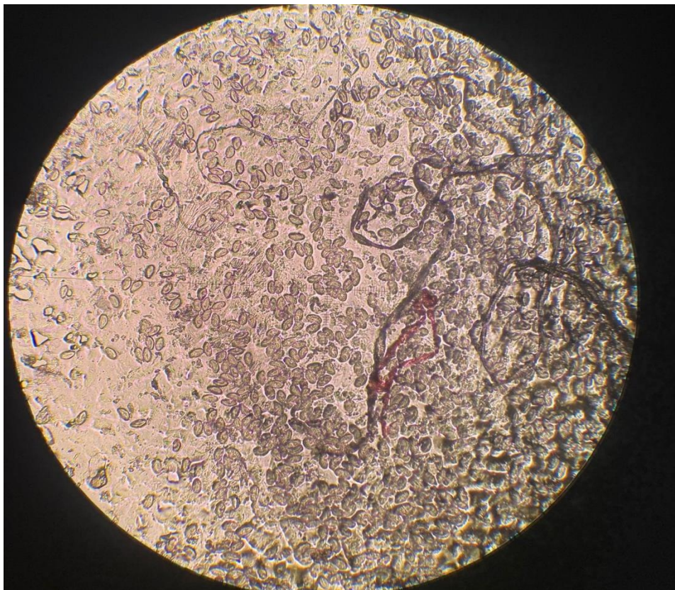
Slika 3. Jaja E. vermicularis u perianalnom otisku, povećanje 10x

Jaja E. vermicularis imaju karakterističan ovalni, izduženi oblik nalik na nogometnu loptu s jednom blago spljoštenijom stranom. Također imaju debelu ljusku. Jaja često sadrže potpuno razvijeni embrij koji je vidljiv pod mikroskopom. Jaja su u perianalnom otisku prozirna (15, 25).