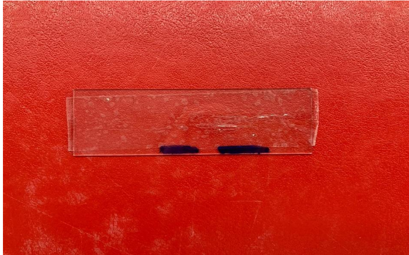
Slika 2. Perianalni otisak

Jaja E. vermicularis imaju karakterističan ovalni, izduženi oblik nalik na nogometnu loptu s jednom blago spljoštenijom stranom. Također imaju debelu ljusku. Jaja često sadrže potpuno razvijeni embrij koji je vidljiv pod mikroskopom. Jaja su u perianalnom otisku prozirna (15, 25).