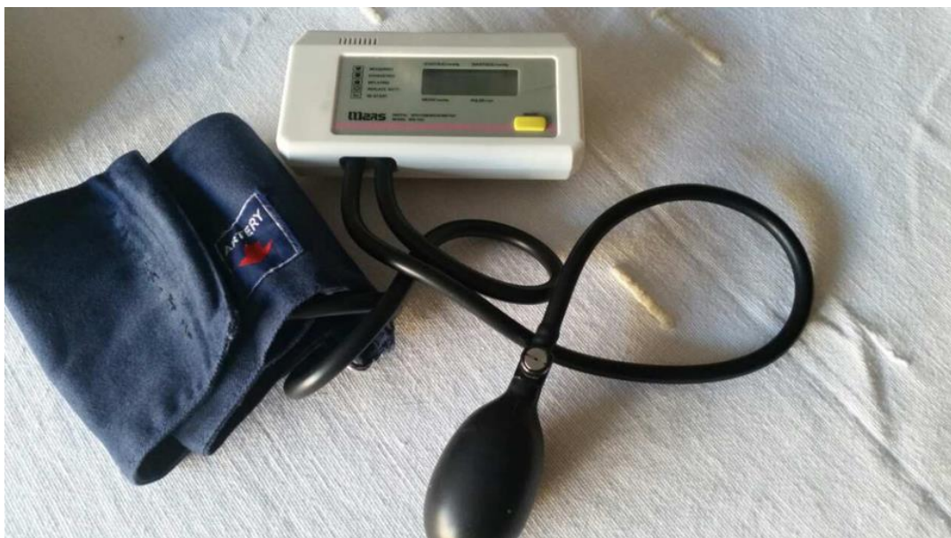
Slika 4. Digitalni tlakomjer za nadlakticu Mars MS-702