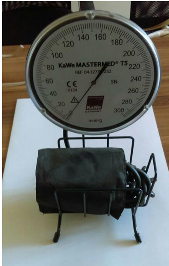
Slika 1. Oscilometrijski tlakomjer KaWe MASTERMED