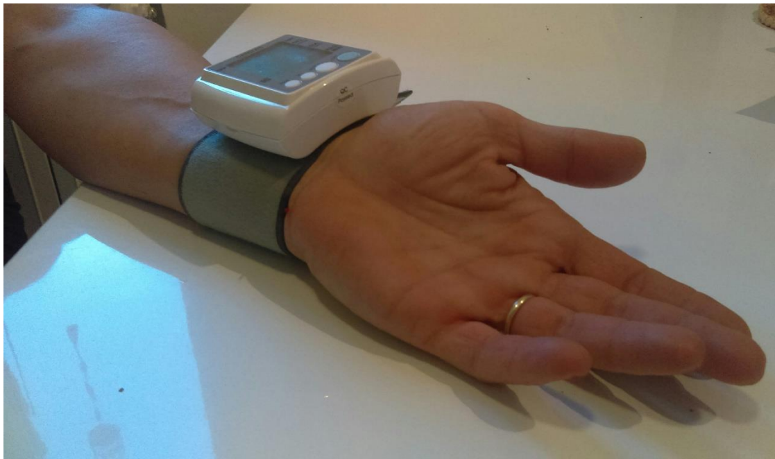
Slika 3. Mjerenje tlaka digitalnim tlakomjerom za podlakticu