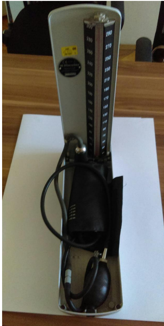
Slika 5. Klasičan živin tlakomjer marke Riester, baždaren 2008. godine