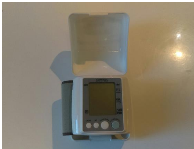
Slika 2. Digitalni tlakomjer za podlakticu Sanitas SBM 06