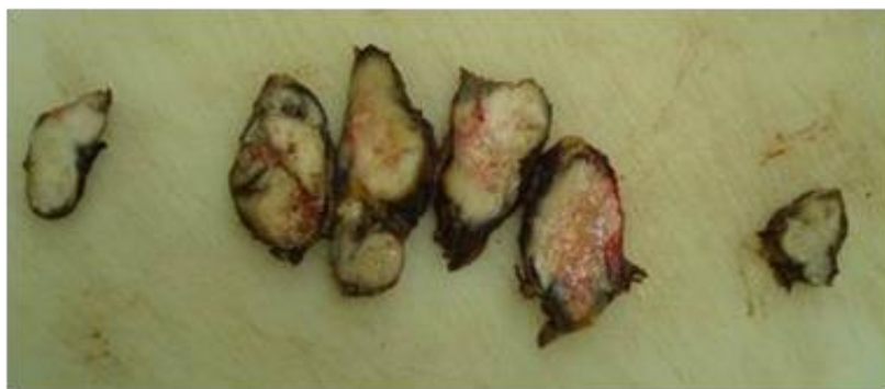
Slika 3. Limfni čvorovi vrata prožeti tumorom (PHD 584-07, makroskopski prikaz).

Učestalost metastaziranja varira ovisno o lokalizaciji i veličini tumora, što se objašnjava različitim embriološkim porijeklom supraglotičkog i glotičko-subglotičkog dijela larinksa što je dovelo do odvojenosti limfne drenaže (31). Supraglotički tumori, u odnosu na glotičke, češće daju limfogene metastaze zbog bolje razvijene limfne mreže (32). Incidencija pozitivnih cervikalnih limfnih čvorova u supraglotičkim tumorima je 35 %, uz čestu pojavu okultnih metastaza (33). Limfna drenaža oba područja uglavnom završava u regijama II i III cervikalnih limfnih čvorova, za razliku od subglotičkog kojem završava u regijama III i IV. Subglotički karcinomi često metastaziraju i u prelaringealni Delfijski čvor u regiji VI što se povezuje s lošom prognozom i visokom razinom lokalnog recidiva (34). Udaljene metastaze u kosti i pluća također su češće u odnosu na ostala područja (31) (slika 3.).