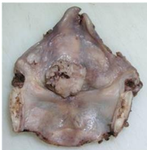
Slika 2. Planocelularni karcinom larinksa, PHD 584-07, supraglotička lokalizacija.

S obzirom na primarno sjelo, tumor može biti supraglotički, glotički ili subglotički (slika 2.). Izraz „transglotički tumor“ označava tumore koji prelaze kroz Morgangijev ventrikulus i pritom zahvaćaju glotis i supraglotis s mogućom zahvaćenošću subglotisa (30).