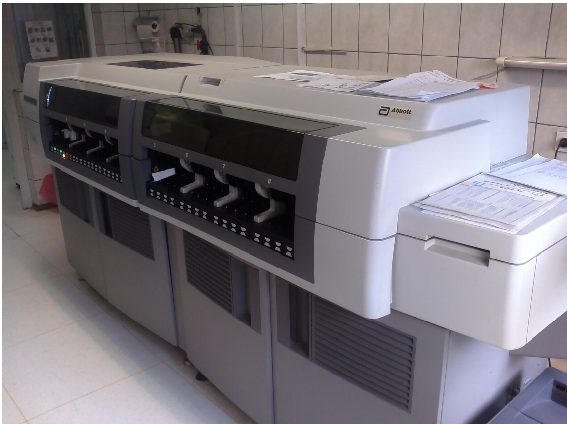
Slika 1. Analizator ARCHITECT 4100

Brzina rada analizatora je 800 testova na sat. Sustav za manipulaciju uzoraka sastoji se od etiri podjedinice sa po pet podjedinica za nosa e uzoraka. Jedan spremnik za reagense sadrfli 90 pozicija koje se koriste za R1 i R2 komponente reagensa, te moľe pohraniti reagense za 50-55 razli itih testova. Ovo istraflivanje je ra eno u biokemijskom laboratoriju Op e bolnice Slavonski Brod.