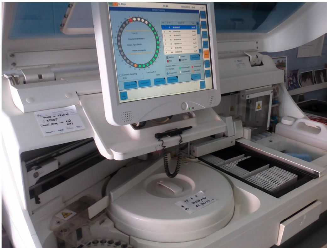
Slika 2. Analizator Cobas e 411

Koncentracije PTH i vitamina D određene su na imunokemijskom analizatoru Cobas e410.