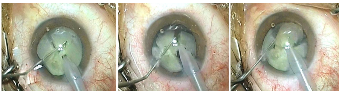
Slika 2. Usitnjavanje i aspiracija zamućene leće tijekom fakoemulzifikacije kroz rez od 2,75 mm (1).

Fakoemulzifikacija je metoda ekstrakapsularne ekstrakcije leće pomoću ultrazvuka koji u današnje vrijeme znači standard u operaciji katarakte. Izvodi se kroz rez na rožnici veličine svega 2-3 mm. Pomoću ultrazvučne sonde nukleus leće se usitnjava uz istovremenu aspiraciju usitnjenih komadića leće. Osnovni problem u početku razvoja ove metode operacije bilo je oštećenje endotela rožnice slobodnim radikalima i energijom ultrazvuka. Problem je riješen napretkom kirurške tehnike i tehnologije te razvojem viskoelastika, specijalnih viskoelastičnih gelova (1).