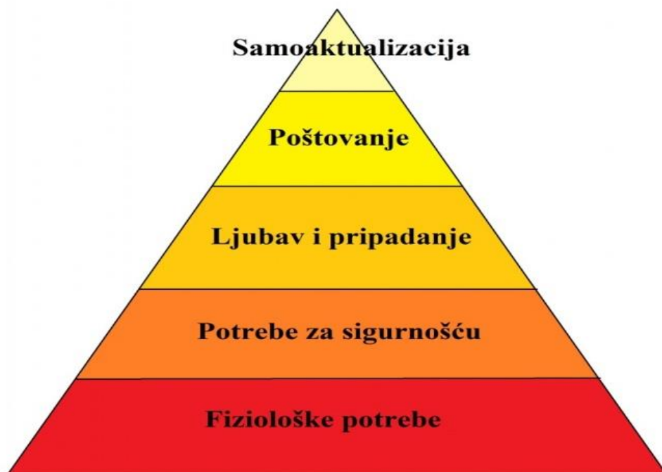
Slika 1. Maslowljeva hijerarhija potreba