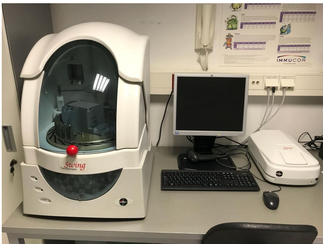
Slika 2. Twin sampler swing

Određivanje Rh(D) krvne grupe izvodi se pomoću anti-D testnog reagensa uz RhD negativnu kontrolu. Pozitivna reakcija (aglutinacija) određuje da je osoba RhD pozitivna (+), a negativna reakcija (izostanak aglutinacije) da je RhD negativna (=).